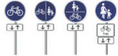
Verkehrszeichen für das Befahren linker Rad-/ Gehwege